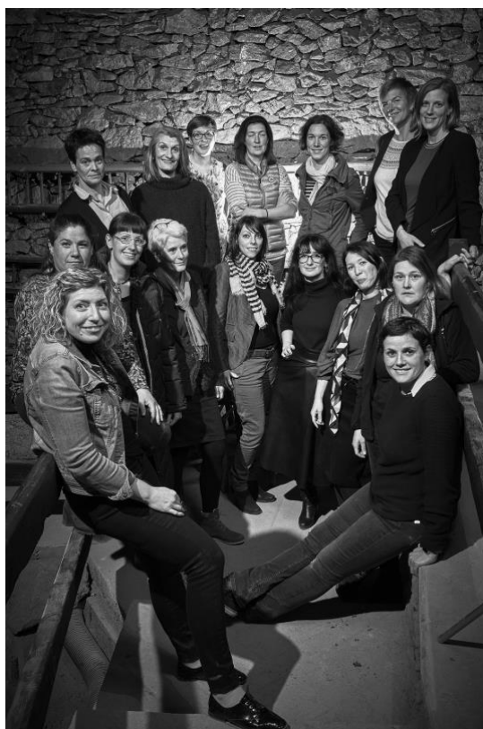
Les Artisanes du Vin suisse

Pour souligner leur engagement pour la Semaine suisse du Goût, les Artisanes ont concocté un programme de réjouissances auxquelles toutes et tous sont conviés. Chaque Artisane présentera ainsi un accord mets et vin dans son domaine. Les spécialités des terroirs de Suisse seront bien sûr à l'honneur. Ces événements seront complétés par d'autres en lien avec des acteurs gustatifs et culturels.